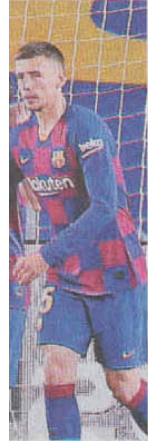
ਦੇ ਸਾਥੀ ਖਿਡਾਰੀ।

11। ਮੰਗਲਵਾਰ ਨੂੰ ਖੇਡੇ ਵਚ ਪੰਜਵੇਂ ਸਥਾਨ 'ਤੇ ਨੇ ਏਸਪੈਨਿਓਲ ਨਾਲ ਖੇਡਿਆ ਜਦਕਿ ਸੱਤਵੇਂ ਰੀਅਲ ਨੇ ਮਾਲੋਰਕਾ ਨਾਲ ਹਰਾਇਆ।