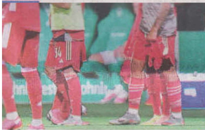
ਸ 'ਚ ਖੁਸ਼ੀ ਸਾਂਝੀ ਕਰਦੇ ਬਾਇਰਨ ਮਿਊਨਿਖ ਦੇ ਫੁੱਟਬਾਲਰ।

ਇੰਗਲੈਂਡ ਦੇ ਵਿਕਟਕੀਪਰ ਬੱਲੇਬਾਜ਼ ਜਾਨੀ ਬੋਰਸਟੇ ਨੂੰ ਉਮੀਦ ਹੈ ਕਿ ਉਹ ਵੈਸਟਇੰਡੀਜ਼ ਖਿਲਾਫ ਅਗਲੀ ਟੈਸਟ ਸੀਰੀਜ਼ ਲਈ ਟੀਮ ਵਿਚ ਆਪਣੀ ਥਾਂ ਮੁੜ ਤੋਂ ਹਾਸਲ ਕਰ ਲੈਣਗੇ।