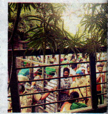
ਮਿੰਨੀ ਸਕੱਤਰੇਤ ਦਾ ਗੇਟ ਬੰਦ ਕਰਕੇ ਮੁਲਾਜ਼ਮ ਤ ਕਰਨ ਦੇ ਨਾਲ-ਨਾਲ ਗ੍ਰਾਮ

ਨੇ ਡਿਪਟੀ ਕਮਿਸ਼ਨਰ ਬਠਿੰਡਾ ਦੇ ਦਫ਼ਤਰ ਅੱਗੇ ਅਣਮਿਥੇ ਸਮੇਂ ਲਈ ਪੱਕਾ ਮੋਰਚਾ 28ਵੇਂ ਦਿਨਾਂ ਤੋਂ ਲਾਇਆ ਹੋਇਆ ਹੈ। ਦਿੱਤੇ ਜਿਸ ਕਾਰਨ ਕਈ ਵੱਡੇ ਸਰਕਾਰੀ, ਮਿਗਲਵਾਰ ਨੂੰ ਧਰਨੇ ਵਿਚ ਮਾਲਵਾ ਖੇਤਰ ਦੇ ਕਈ ਜ਼ਿਲ੍ਹਿਆਂ ਦੇ ਕਿਸਾਨਾਂ ਨੇ ਸ਼ਮੂਲੀਅਤ ਕਰ ਕੇ ਜ਼ਿਲ੍ਹਾ ਪ੍ਰਸ਼ਾਸਨ ਤੇ ਪੰਜਾਬ ਸਰਕਾਰ ਖ਼ਿਲਾਫ਼ ਨਾਅਰੇਬਾਜ਼ੀ ਕੀਤੀ। ਕਿਸਾਨਾਂ ਨੇ ਮੰਗਲਵਾਰ ਸਵੇਰੇ ਤੋਂ ਹੈ ਮਿਨੀ ਸਕੱਤਰੇਤ ਅੱਗੇ ਬਠਿੰਡਾ-ਮਾਨਸਾ ਰੋਡ ਦੀ ਸੜਕ ਦਾ